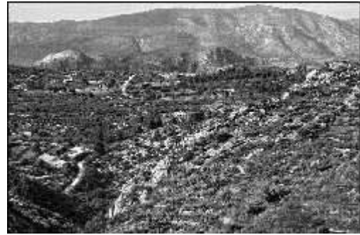
Imagen de los cuatro millones de metros cuadrados de terreno que una promotora pretende usurpar en la Vall d'Ebo

Los cuatro millones de metros cuadrados que la mercantil está intentando usurpar en la Vall d'Ebo son suelo rústico, en su mayoría banales de almendros y olivos. El concejal de Urbanismo apuntó ayer que el 75% de los terrenos son municipales, tal y como consta en el registro de bienes patrimoniales del ayuntamiento, mientras